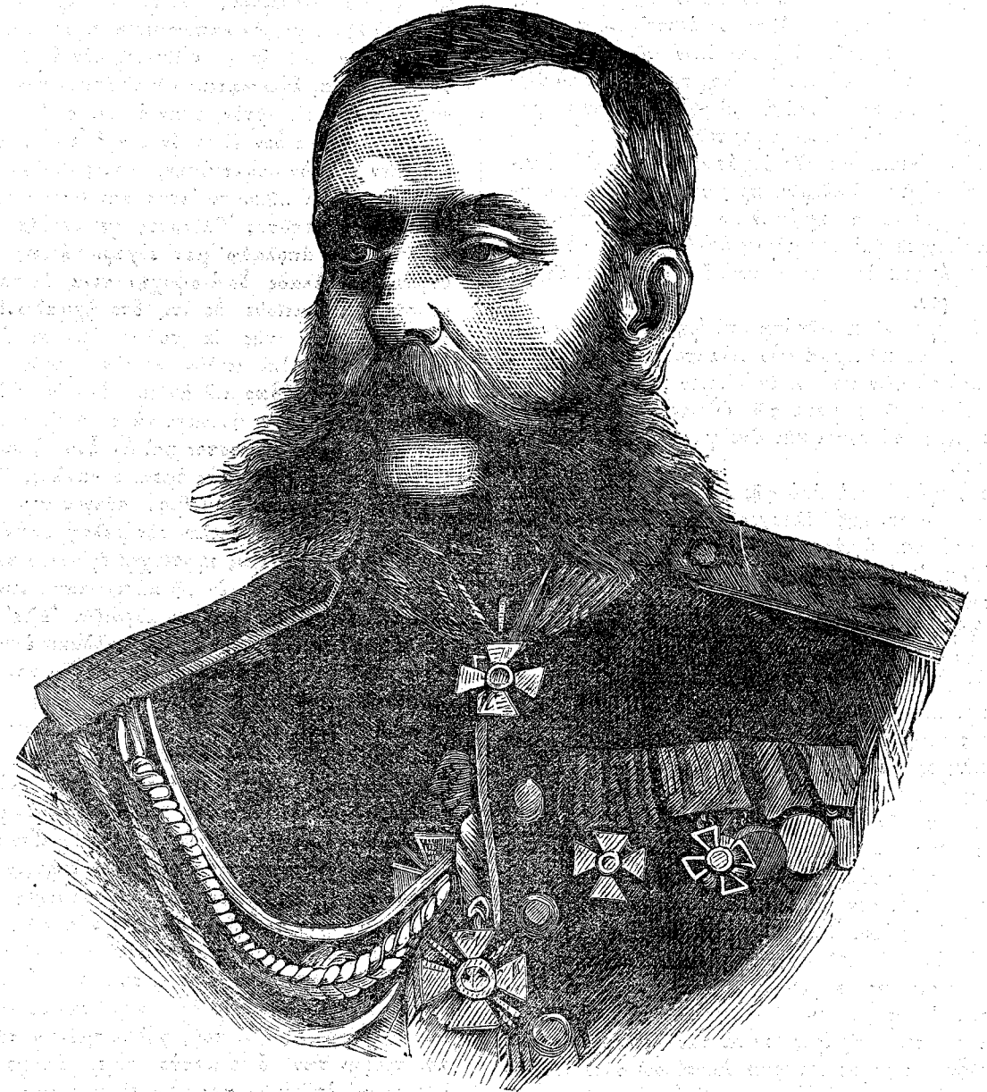
Ὁ Στρατηγὸς ΣΚΟΒΕΛΕΦ.

Ὁκτὸ περίπου ἡμέρας ἀπὸ τῆς ἐκκολάψεως, ἡ κε- φαλὴ τοῦ σκώληκος καθίσταται καταφανῶς μείζων, τότε δὲ προσβάλλεται ἐκ τῆς πρώτης αὐτοῦ ἀσθε- νείας, διαρκούσης ἐπὶ τρεῖς ἡμέρας, καθ' ἃς ἀποποιεῖ- ται τροφὴν καὶ μένει ἀκίνητος ὡς ἐν ληθάργῳ. Ὁ με- ταξοσκώληξ αὐξάνει ταχέως καὶ ἐν βραχεί χρόνῳ, τὸ